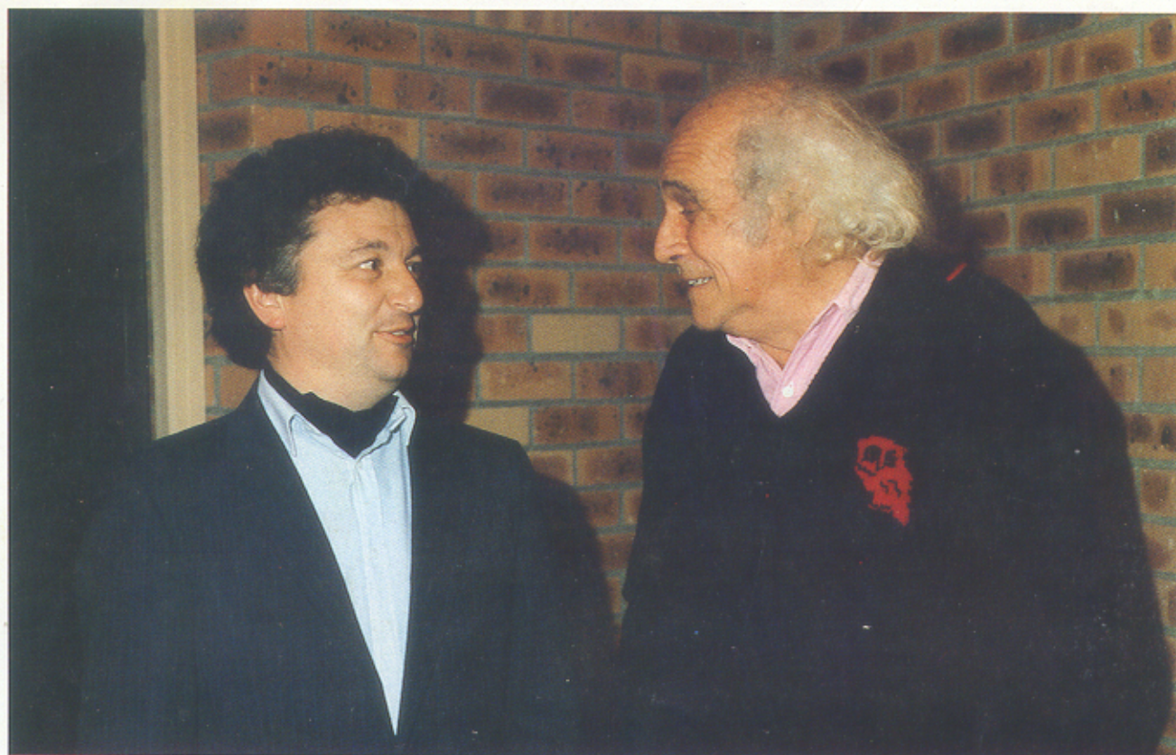
Léo Ferré et Roland de Clynsen

Pour la première fois, nous avons rassemblé l' œuvre poétique de Léo Ferré , y compris l'Opéra du Pauvre. Vous trouverez dans cet ouvrage les textes immortels du grand chanteur, vous découvrirez aussi les écrits les plus secrets du poète, restés jusqu'à ce jour dispersés ou inédits.