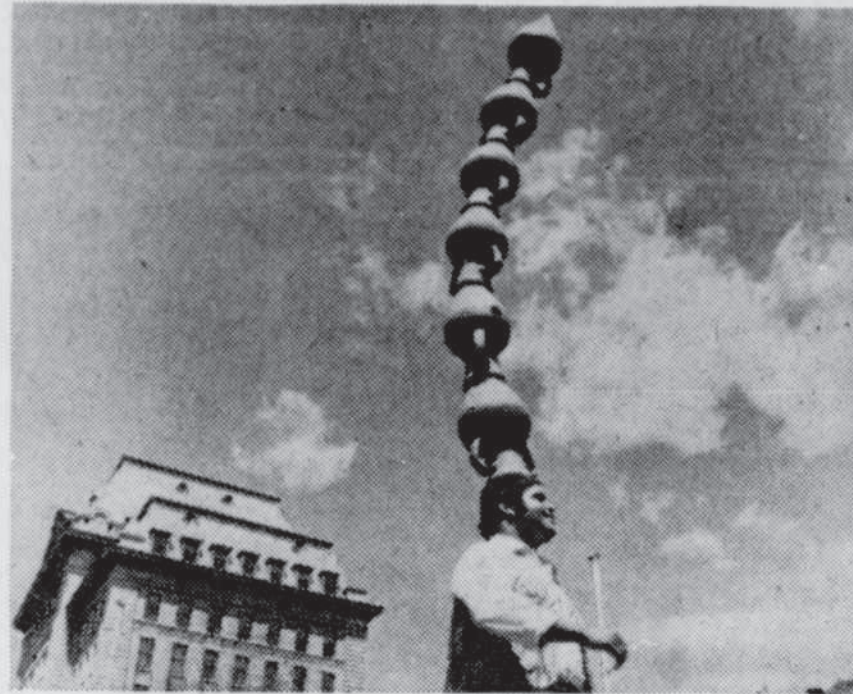
Le Soleil, J.-M. Villeneuve

Le service de sécurité du festival d'été et la police des plaines demandent la collaboration des gens qui apporteront des boissons à consommer lors du spectacle de clôture. On demande de ne pas apporter de bouteilles de verre, ça élimine un certain risque d'accidents et ça facilite la tâche pour le nettoyage.