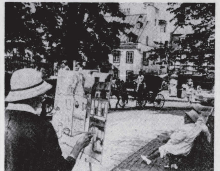
Le Soleil, Clément Thibault

21h — Le Requiem de Mozart et Vêpres d'un