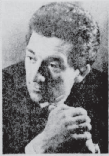
Mercredi, le 11 février, au théâtre Capitol, le jeune et brillant pianiste Nicolai Petrov sera soliste avec l'orchestre philharmonique de Moscou.