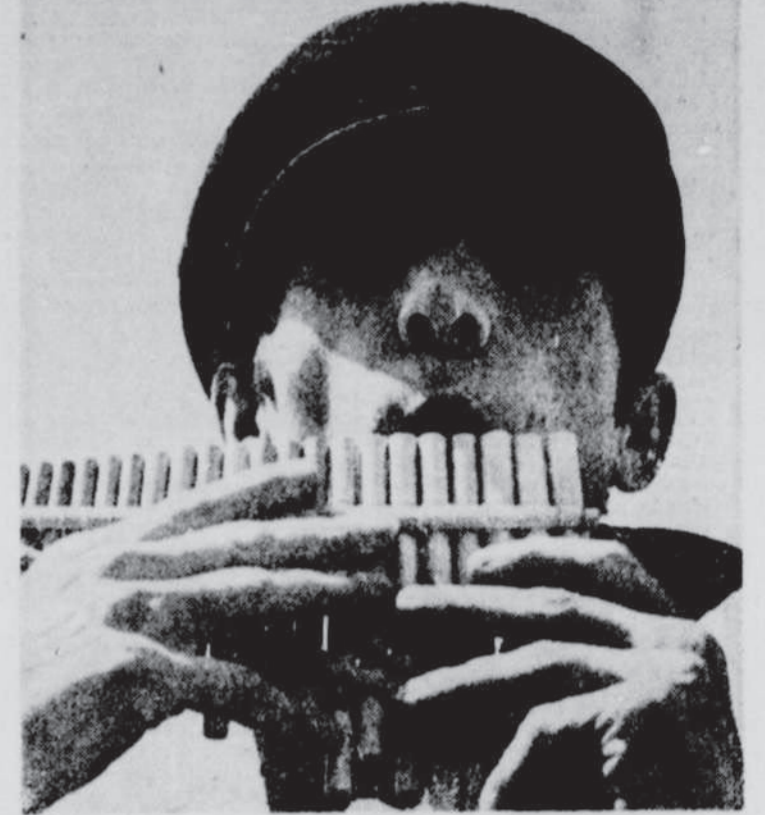
FILM DE GILLES GROULX — Québec verra en fin de semaine au Ciné-Campus (Cité universitaire) le deuxième film de Gilles Groulx: OU ETES-VOUS DONC?, avec Georges Dor et Mouffe. Ce film, qui vient de sortir de l'ONF est considéré par des cinéphiles avertis comme un chef-d'oeuvre de l'auteur du CHAT DANS LE SAC.