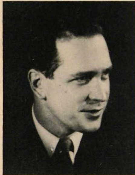
M. Robert Laffont, éditeur.