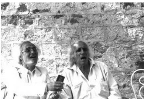
Giuseppe Gennari e Léo Ferré

Omaggio a Ferré con canzoni in nuove versioni Presentazione dell' ultimo album di Balestrieri