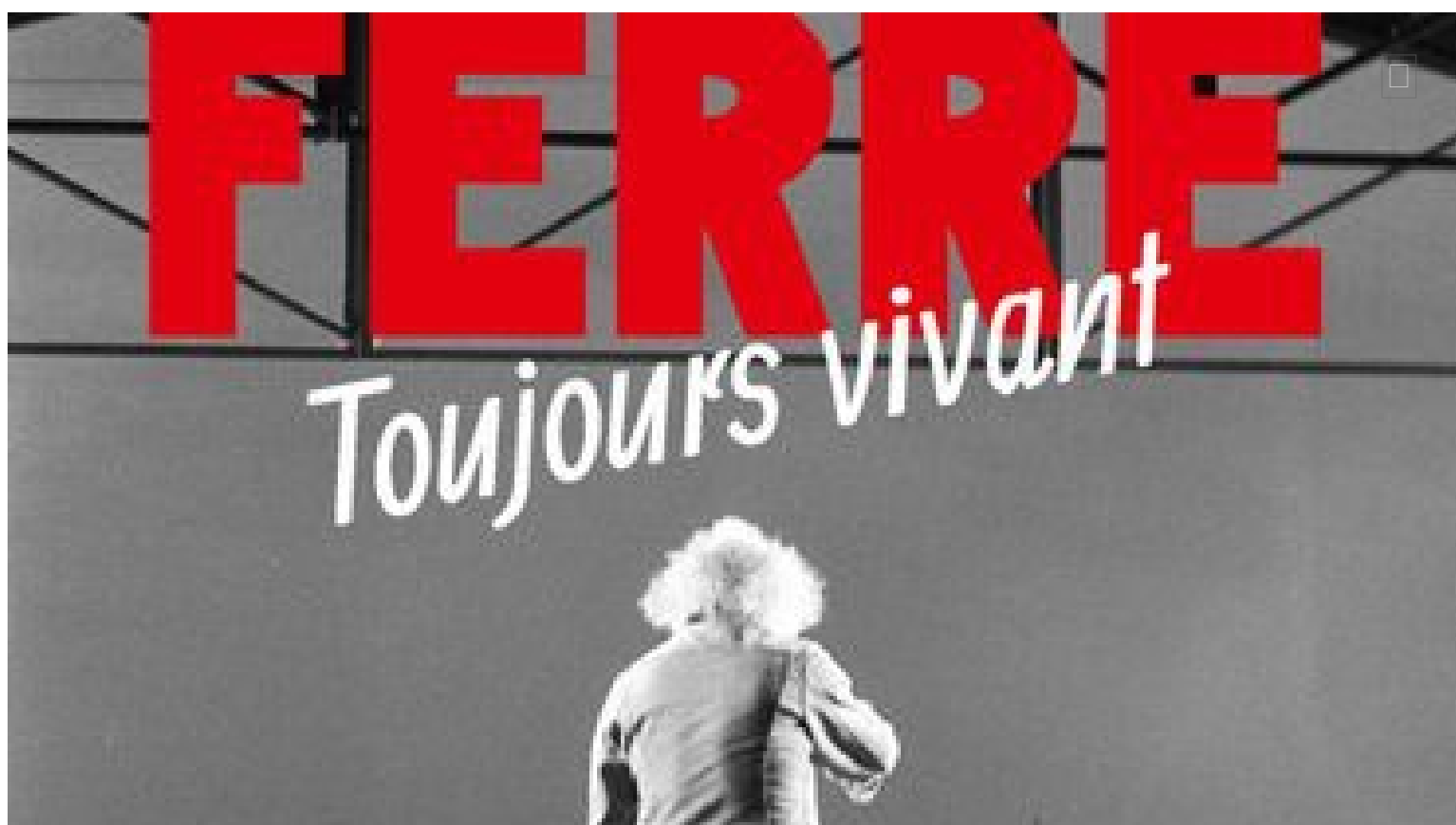
Léo Ferré, Toujours Vivant