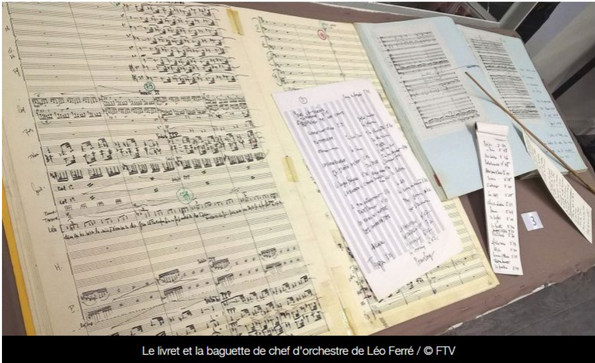
Le livret et la baguette de chef d'orchestre de Léo Ferré